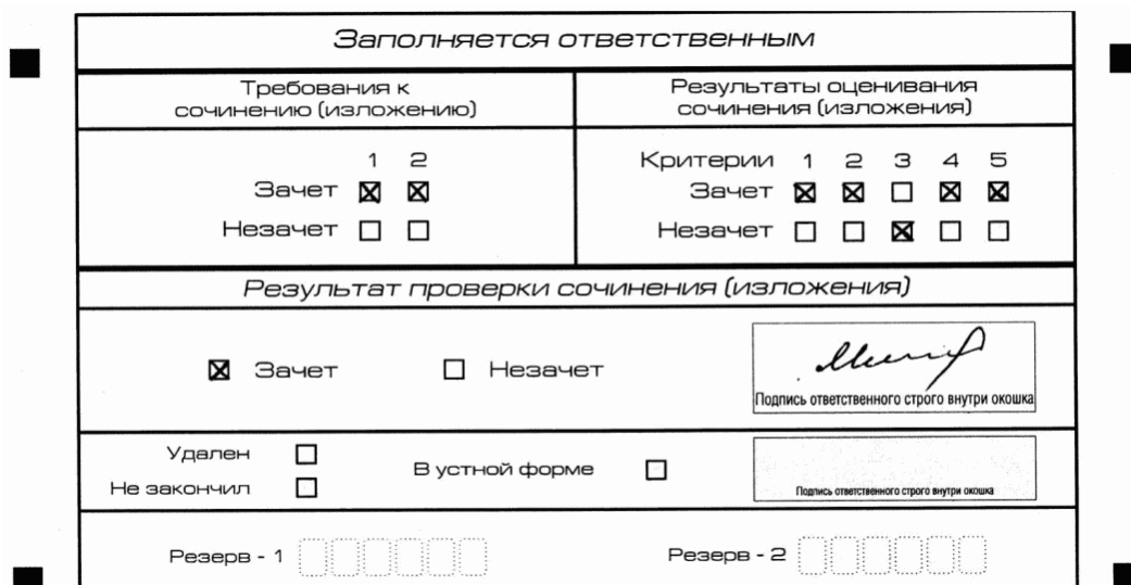
Рис. 10. Область для оценки работы

3. Во всех остальных случаях итоговое сочинение (изложение) проверяется по всем пяти критериям и оценивается по системе "зачет"/"незачет".