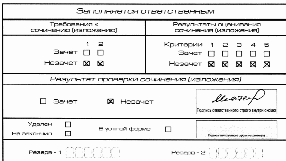
Рис. 8. Область для оценки работы

Выставляется "незачет" за невыполнение требования N 2. В клетки по всем критериям оценивания выставляется "незачет". В поле "Результат проверки сочинения (изложения)" ставится "незачет" (см. рис. 9).