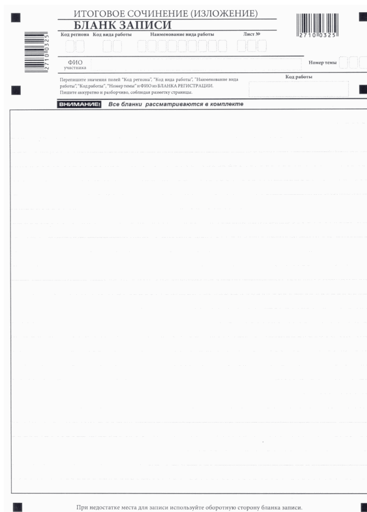
Рис. 5. Лицевая сторона двустороннего бланка записи